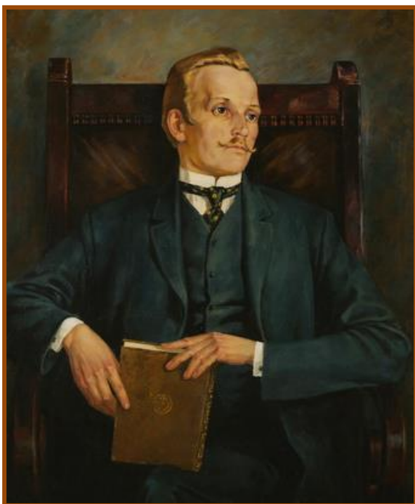
Янка Купала Михаил Андреевич Савицкий (портрет из коллекции Национального художественного музея Республики Беларусь)

13. Янка Купала и Якуб Колас : летопись жизни и творчества [Электронный ресурс] // Национальная библиотека Беларуси. – Режим доступа: http://www.nlb.by/portal/page/portal/index/content?lang=ru&classId=04FB45A523EC4CBDBFE8F52ED0EC82F7